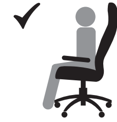
СИДИТЕ НА ВСЕМ СИДЕНИИ