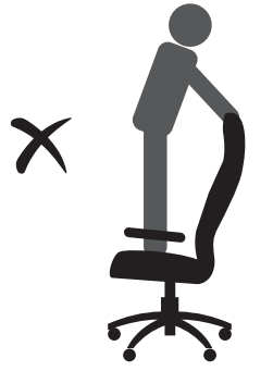
НЕ СТОЙТЕ НА КРЕСЛЕ