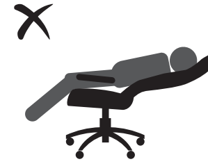
НЕ ОПИРАЙТЕСЬ НА СПИНКУ