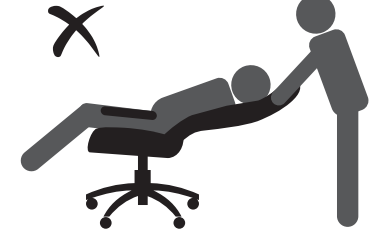
НЕ ОПИРАЙТЕСЬ НА СПИНКУ