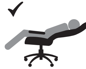
ВЕС ДОЛЖЕН БЫТЬ РАСПРЕДЕЛЕН НА ВСЕ СИДЕНЬЕ