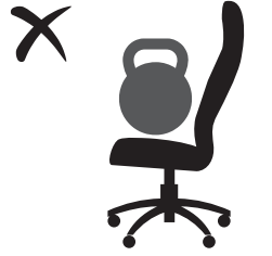
НЕ ПРЕВЫШАТЬ ДОПУСТИМЫЙ ВЕС