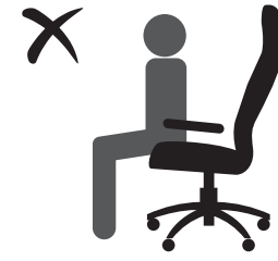
НЕ СИДИТЕ НА КРАЮ