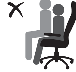
КРЕСЛО НЕ РАССЧИТАНО ДЛЯ ДВОИХ ЛЮДЕЙ!